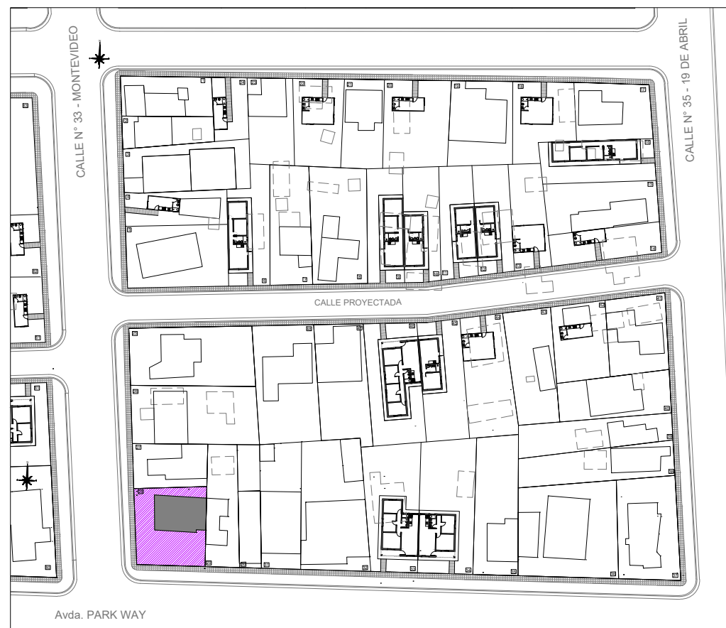
Plano de ubicación esc. 1.1000